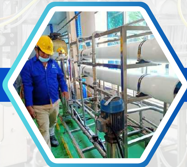
HỆ THỐNG RO CÔNG NGHIỆP