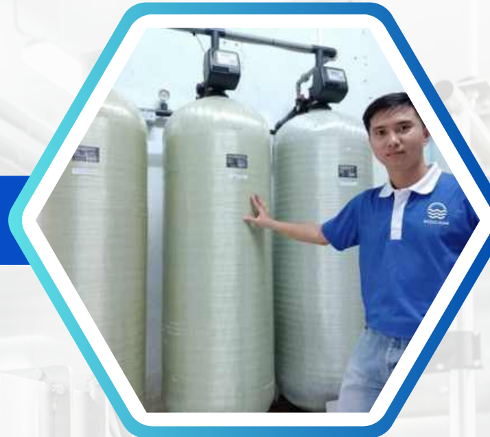
HỆ THỐNG TIỀN LỌC