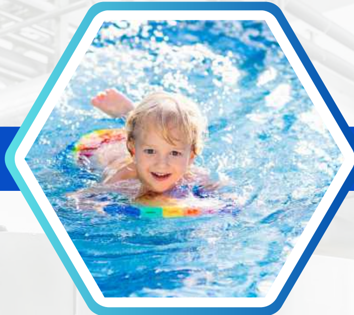
KHỬ TRÙNG OZONE