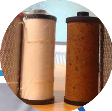
THAY LỖI LỌC VỆ SINH MÁY

Bảo trì, kiểm tra và bảo dưỡng thường xuyên các hệ thống lọc nước để đảm bảo hiệu suất tối ưu và tuổi thọ của chúng.