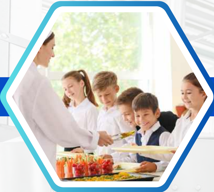
CĂN TIN / TRƯỜNG HỌC