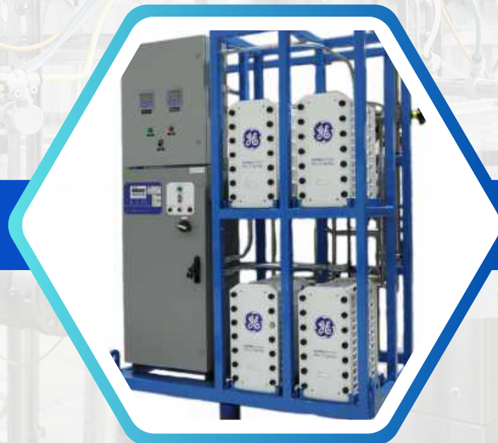
KHỬ ION EDI